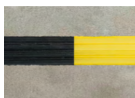
Bandes PVC 3 stries antidérapantes avec et sans protection